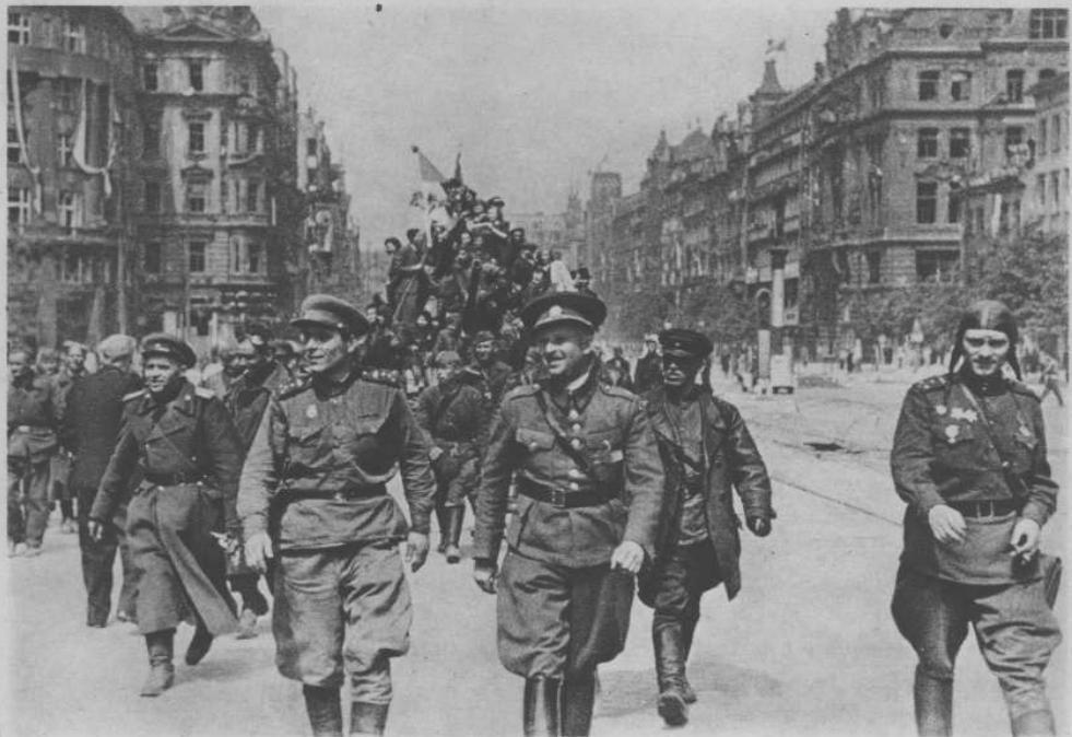
1945. 1. 15. Praha na V. n.