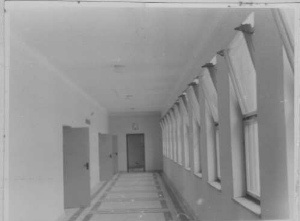
Chodba ku školním učebnám.