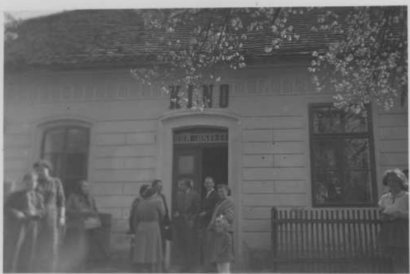
Dům osvěty v Čisovicích.