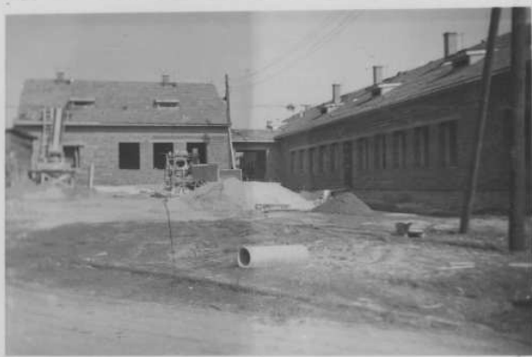
Starba národní školy v Čisoviciích