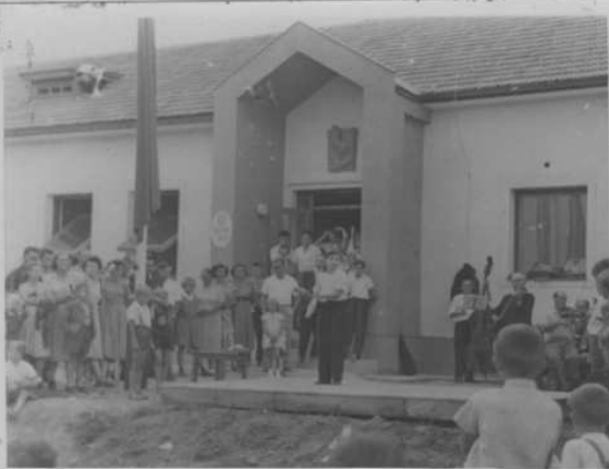
Slavnost otevření nové školy 28.8.1955.

Budova školy ale vnejším vřledu není sice vřmilajším dílem ale za to vřitřní zařizení a uspořádm jest nanejším účelné a vřtvoruje vřm podmíněm novodobě- lo školství. Hlavní věc, že ji máme, že je naše a proto z ní máme radost.