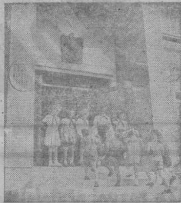
Plavčíci nové školy v Čisovicích vítají své kamarády.

nebo horníky. Čeká je budoucnost, o které se předcházející generaci opravdu jen zdálo. Čisovická škola má všechny předpoklady, aby vychovávala mládež dnešní doby, odvážné budovatele naší velké budoucnosti. Tento čestný úkol mají před sebou naši učitelé. Nejsou však odkázáni sami na sebe. O zdravý růst naší příští generace, duševní i fyzický, pečují strana a vláda. V rodičích dětí najdou pak učitelé jistě své nejlepší pomocníky.