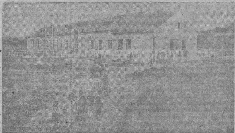
Budova nové školy v Čisovicích byla otevřena v den zahájení školního roku. Děti družstevníků z Bojovic a Čisovic radostně spechaly do školy.

Kdysi se „tatickové obce“ patnáct let radili o tom, zda mají nebo nemají postavit školu, kterou nakonec v roce 1860 postavili takřka do vody u potoka. Celé staletí uplynulo od té doby, než se Čisovíci dočkali dnešního radostného dne. (ký)